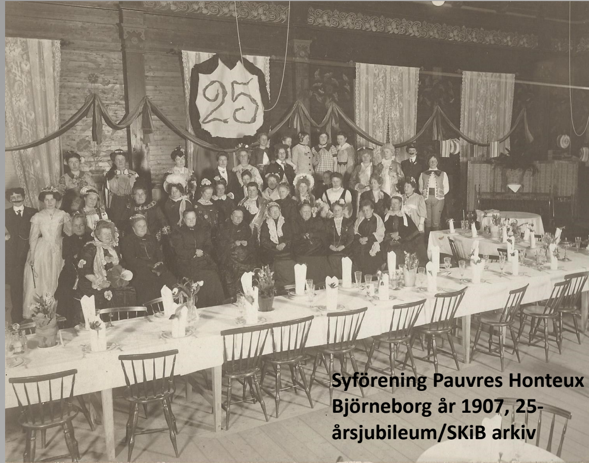
Syförening Pauvres Honteux Björneborg år 1907, 25- årsjubileum