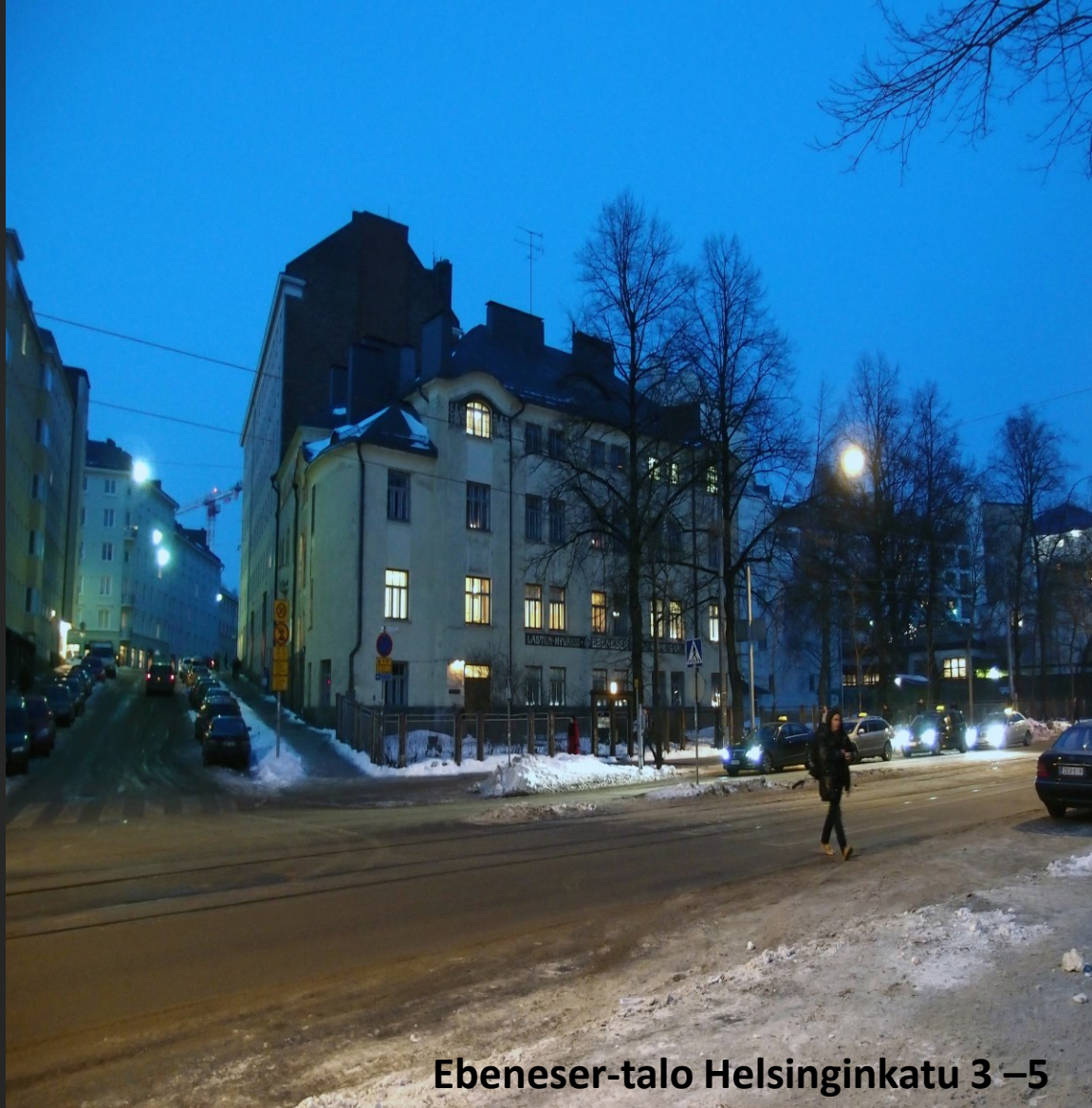
Ebeneser-talo Helsinginkatu 3 –5