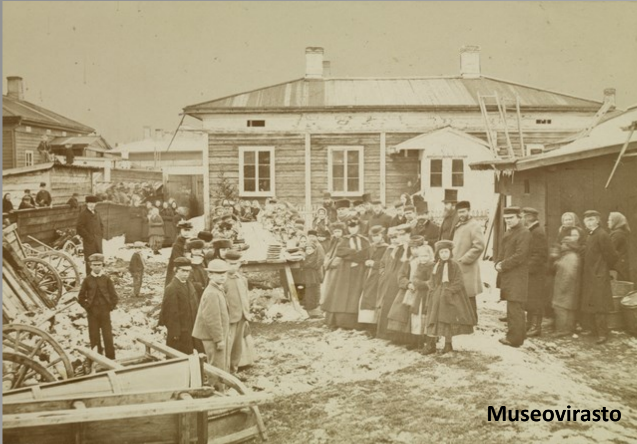
Nälkävuoden 1868 pitkänäperjantaina sadalle köyhälle tarjottu päivällinen Tampereella.

— Kunebergin juhlaa wietettiin täällä teatteri-huoneella viime perjantaina. Ruotsalaisen esitelmän Kunebergistä piti maisteri F ä r l i n g . Sitä paitsi näyteltiin kuwaelmia Kunebergin teoksiesta ja neli-ääninen mies-kwartetti lauloi muutamia ruotsalaisia lauluja. Wäkeä oli runsaasti ja tulot käytetään tänäläisen köyhäin lasten työhuoneen hyväksi.