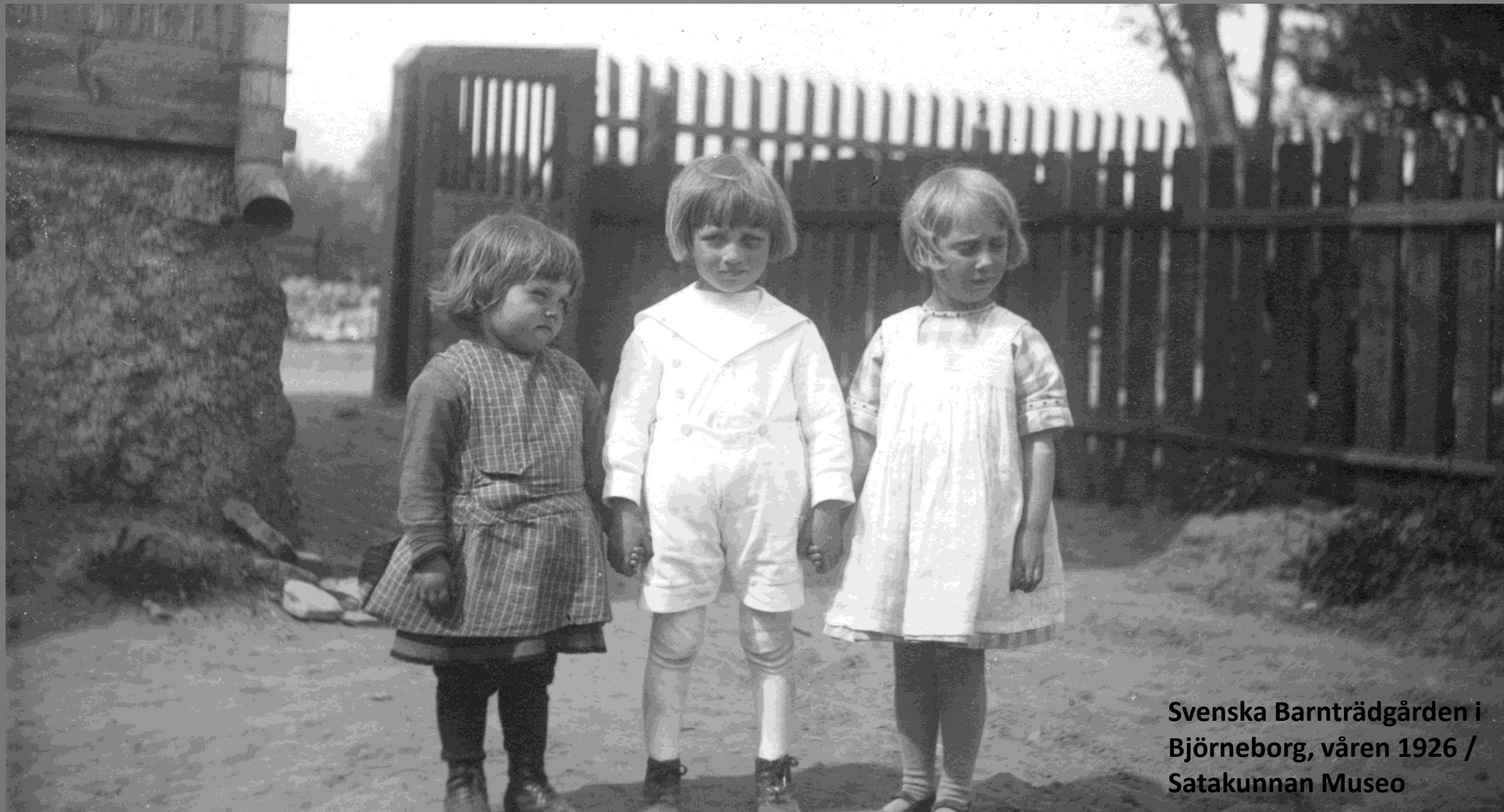
Svenska Barnträdgården i Björneborg, våren 1926