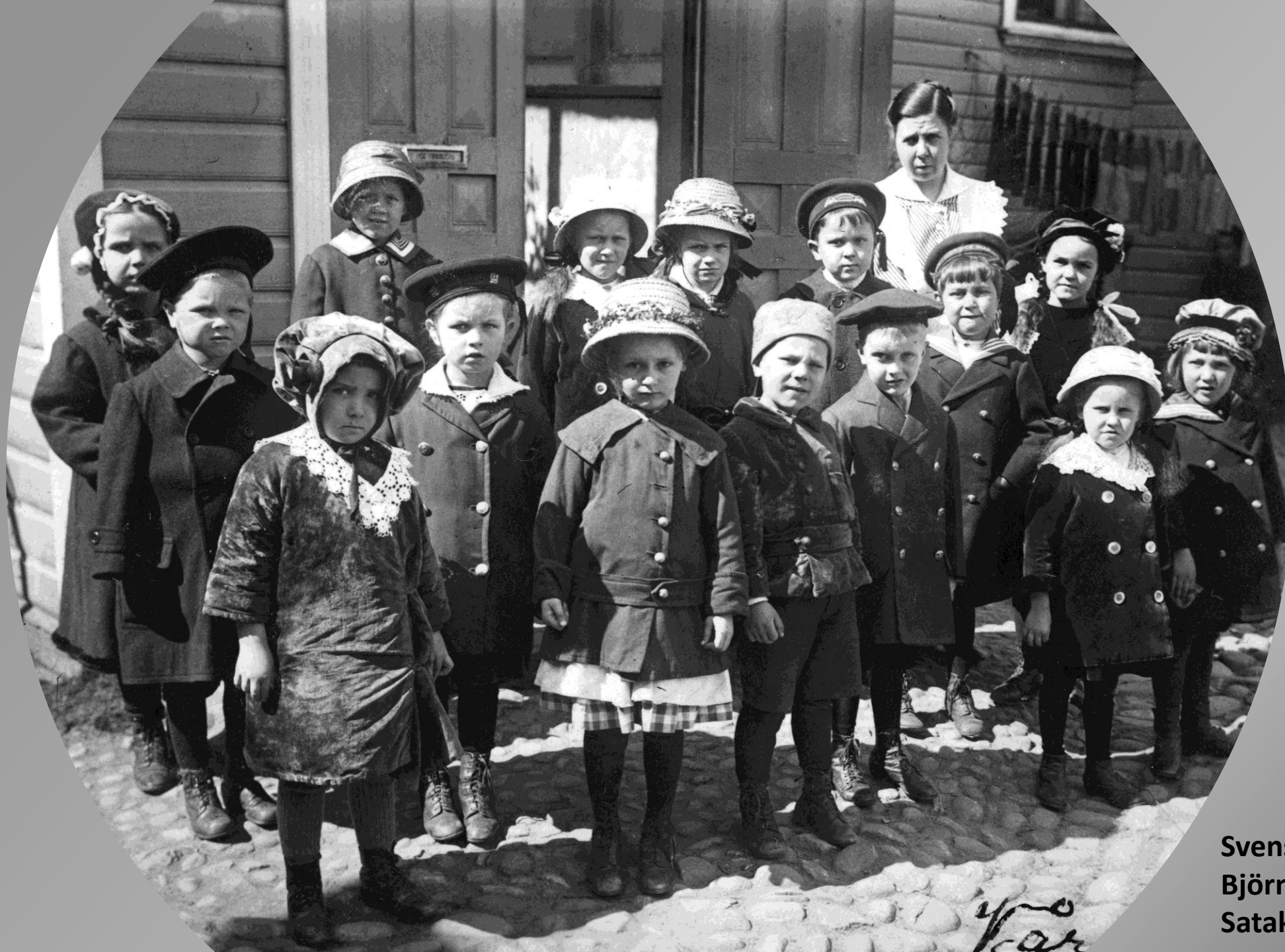
Svenska Barträdgården i Björneborg, våren 1917