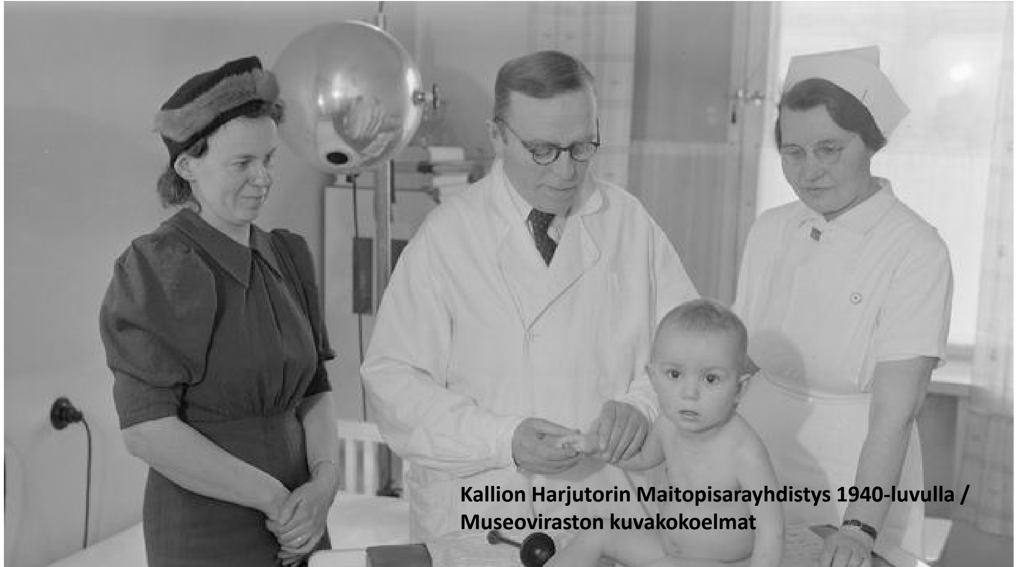
Kallion Harjutorin Maitopisarayhdistys 1940-luvulla