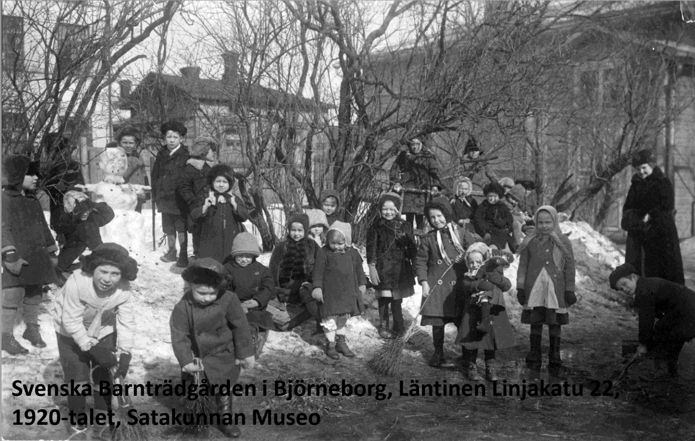
Svenska Barnträdgården i Björneborg, Läntinen Linjakatu 22, 1920-talet, Satakunnan Museo